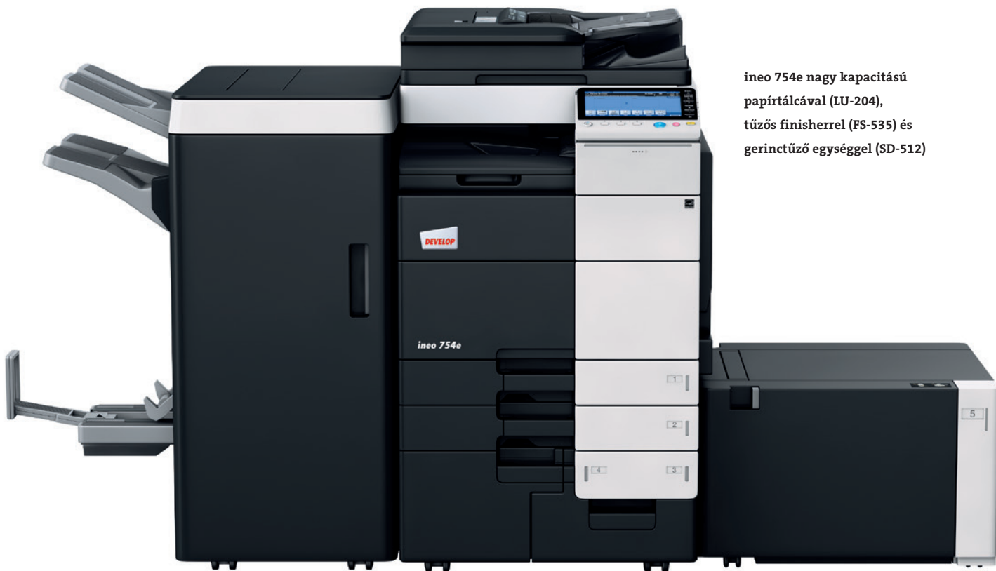
ineo 754e nagy kapacitású papírtálcával (LU-204), tűzós finisherrel (FS-535) és gerinctűző egységgel (SD-512)

Vírusok, trójai falovak, hekkertámadások: manapság egy vállalkozás sem engedheti meg magának, hogy figyelmen kívül hagyja az IT-biztonságot. Ezért az ineo 754e megfelel az ISO 15408 EAL 3-nak, azaz a multifunkciós rendszerek ipari biztonsági szabványának. Sőt, számos adatbiztonsági funkcióval bír, mint például az IPsec titkosítás, amely minden dokumentum számára garantálja a biztonságos kommunikációs csatornát, amely átmegy cége hálózatán. Nem kell attól félni, hogy bizalmas dokumentumok rossz kezekbe kerülnek, mivel a rendszerhez csak azonosított felhasználók férhetnek hozzá, melyet a gép a merevlemezének titkosító és autentikáló technológiájával ellenőriz. Ezáltal a szenzitív adatai biztonságban maradnak a jelenben és a jövőben is.