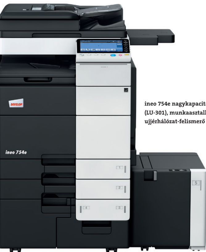
ineo 754e nagykapacitású papírtálcával (LU-301), munkaasztallal (WT-506) és ujjérhálózat-felismerő egységgel (AU-102)

Az ineo 754e 75 A4-es oldalt nyomtat ki és másol percenként (lap/perc). Ez azt jelenti, hogy az alkalmazottai bármekkora mennyiségű munkát ráhagyhatnak a gépre, miközben folytathatják napi feladataikat. Egy többfelhasználós környezetben, akár egy osztályról vagy központi irodáról vagy nyomtatószalonnál legyen szó, nem kell annyit várakozni a nyomtatási munkák elvégzésére. Mivel ez a készülék nagy sebességű kétoldalas (duplex) nyomtatásra és másolásra is alkalmas, pénzt takaríthat meg azzal, hogy kevesebb papírt fogyaszt.