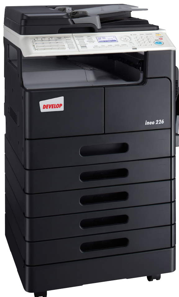
ineo 226, eredeti duplex lapadagoló (DF-625), fax funkció, duplex egység (AD-509), kiegészítő papírtálcák (PF-507), és gépasztal (DK-708)

Az ineo 226 első osztályú nyomtatás minőségét az ultrafinom részecskéjű HD toner garantálja. A különbség szemmel látható a szimpla szürkeárnyalatos gradáció között pl. a jól olvasható és éles, kristálytisza betűk láttán.