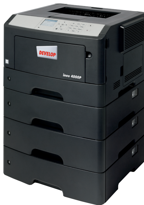
ineo 4000P három papíradagolóval (PF-P12)

Amennyiben a jelenlegi nyomtatójának, illetve azon belül is az operációs rendszerének használata túlságosan nehézkes, ideje megfontolnia, hogy ineo 4000P-re váltson. A 2,4 hüvelykes színes érintőkijelzője egyszerű működtetést tesz lehetővé, valamint információt nyújt a nyomtatási folyamatról, illetve azon keresztül érheti el a beállításokat. Ezen kívül a mappaszerkezetes navigációnak köszönhetően az ineo 4000P használata könnyebb, mint sok régebbi eszköze. Ez időt és energiát takaríthat meg a felhasználók számára. A felhasználóknak nem szükséges áttanulmányozniuk a használati utasítást ahhoz, hogy kezelni tudják az új nyomtatót.