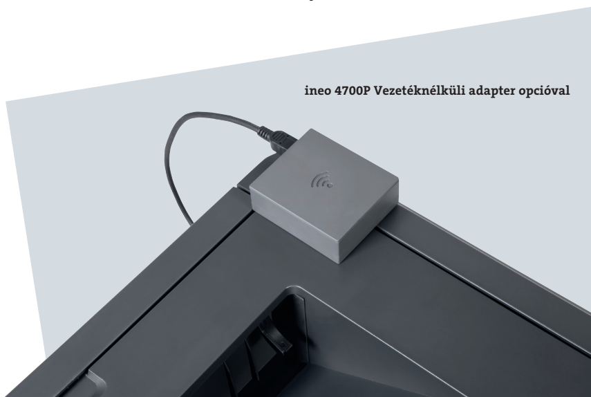
ineo 4700P Vezetéknélküli adapter opcióval

Ha nincs sok hely az irodában vagy kifejezetten asztali nyomtatóra van szüksége, az ineo 4700P nagy előnnyel rendelkezik a könnyűszerkezetes kialakításával és kis helyigényével. Az, hogy ez a hatékony irodai nyomtató könnyedén rátehető egy asztalra és nem kell hozzá külön helyiség, hihetetlenül nagy kényelmet jelenthet egy HR-es vagy gazdasági osztály számára. Különösen, ha nem szeretnék, hogy bizalmas dokumentumok illetéktelen kezekbe kerüljenek.