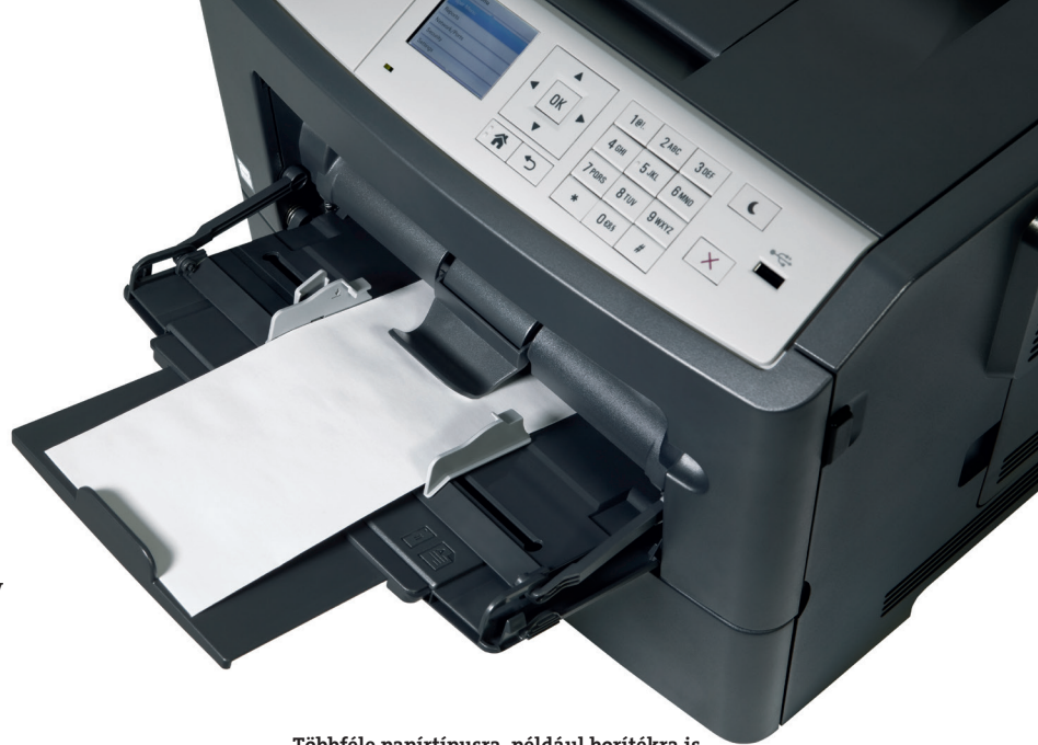
Többféle papírtípusra, például borítékra is nyomtathatunk az ineo 4700P segítségével