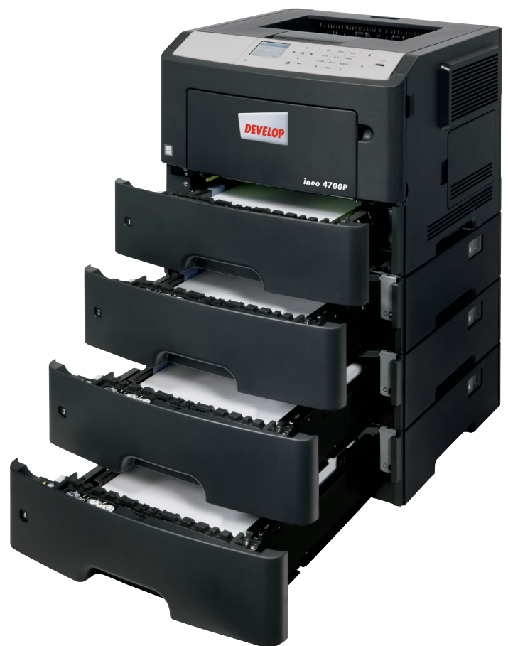
ineo 4700P három papíradagolóval (PF-P12)

Amennyiben a jelenlegi nyomtatójának, illetve azon belül is az operációs rendszerének használata túlságosan nehézkes, ideje megfontolnia, hogy ineo 4000P-re váltson. A 2,4 hüvelykes színes érintőkijelzője egyszerű működtetést tesz lehetővé, valamint információt nyújt a nyomtatási folyamatról, illetve azon keresztül érheti el a beállításokat. Ezen kívül a mappaszerkezetes navigációnak köszönhetően az ineo 4700P használata könnyebb, mint sok régebbi eszközé. Ez időt és energiát takaríthat meg a felhasználók számára. A felhasználóknak nem szükséges áttanulmányozniuk a használati utasítást ahhoz, hogy kezelni tudják az új nyomtatót.